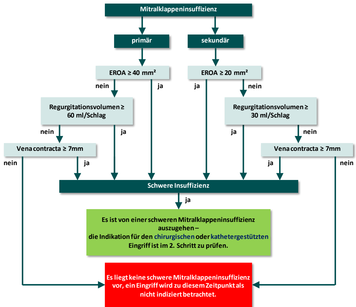
Abbildung 1: Überprüfung des Schweregrads der Mitralklappeninsuffizienz

Nach der europäischen Leitlinie sind Mitralklappeneingriffe bei schwerer Mitralklappeninsuffizienz oder signifikanter Mitralklappenstenose (mittelgradig oder schwer) indiziert. Bei der Indikationsstellung für Herzklappeneingriffe und deren Durchführung und insbesondere auch bei der Beurteilung des Schweregrades einer Mitralklappeninsuffizienz hat die Ultraschalldiagnostik (transthorakale Echokardiografie (TTE) und transösophageale Echokardiografie (TEE)) einen hohen Stellenwert (Baumgartner et al., 2017). Die Berechnungsformeln für den Indikationsindikator verwenden in diesem Rahmen wichtige, meist echokardiographisch erhobene, präoperative Befunde. Der Algorithmus wurde dabei möglichst robust gestaltet, sodass bei fehlender Dokumentation einzelner, in den aktuellen Leitlinien empfohlener, echokardiographischer Befunde die Überprüfung der Indikationsstellung dennoch umsetzbar ist.